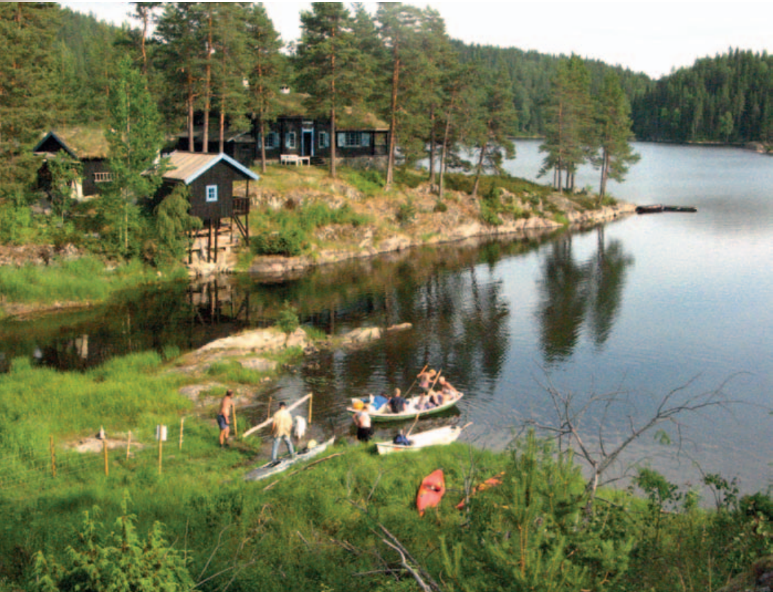
Solberghytta på odden nedenfor Bøvelstad.

I en kontrakt for Bøvelstad fra 1930 skulle den årlige avgiften betales med kr 250,-. Videre står det at «Plassen skal dyrkes forsvarlig osv.» «Gjeter (geiter) eller andre for skogens skadelige husdyr må ikke holdes. Havn for plassens besetning tilkommer leieren i nærmeste utmark, for så vidt det er forenelig med skogens trivsel og hensigtsmessige behandling.» Her ser vi at hensynet til skogen på sett og vis går foran husmannens husdyrhold.