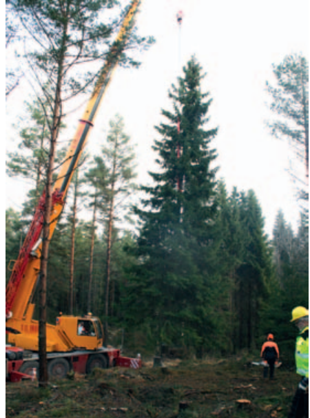
Julegrana heises vekk.