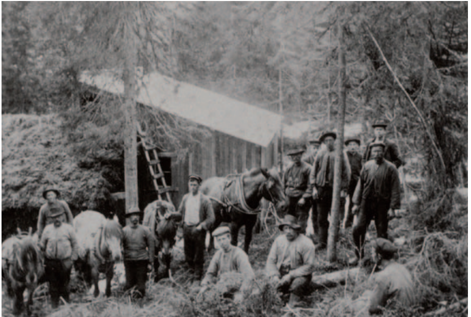
Tømmerkjørere ved Grindern i 1910.