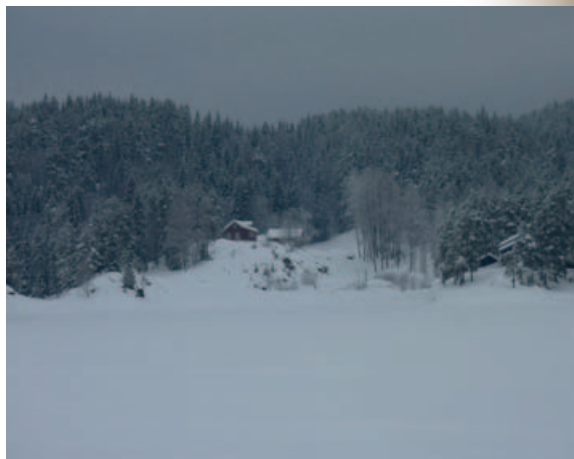
Bøvelstad i vinterdrakt 2011.

Etter Bjørnholdts periode bodde det flere oppsittere på Bøvelstad ennå i noen år, under og etter krigen. Men i 1951 eller -52 var det slutt. Den siste familien, Johansen, måtte flytte på grunn av barnas skolegang. Rausjø skole var blitt nedlagt i 1951 på grunn av for få elever, så skolebarna måtte reise ut av Rau-