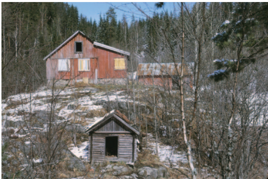
Bøvelstad i 1971 før første restaurering.

sjøgrenda, til Siggerud. Bøvelstad ble fra nå av stående tom i over tyve år, inntil speiderne fra Lambertseter overtok.