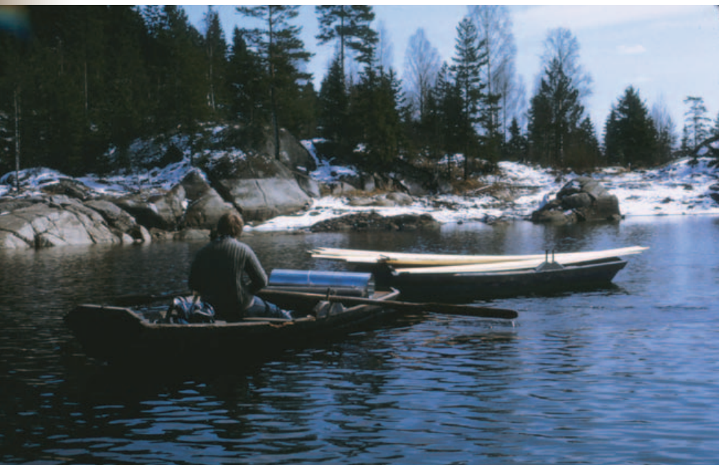
Lambertseterspeiderne frakter materialer til Bøvelstad i 1973.

Nevnes må også de to leteaksjonene etter speidere fra Bøvelstad. Den første var senhøstes på 1970-tallet, da en ung gutt ble sur og ville gå alene hjem fra Grinderen. Han rotet seg bort og ble funnet igjen dagen etter. Den andre store leteaksjonen var i midten av november 1986, da en flokk på ti speidere,