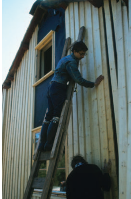
Restaurering i 1973.

Speidertroppen fra Lambertseter bestod av ulvunger, aspiranter og roverlaget. De ulike speiderpatroljene hadde egne turer til Bøvelstad, og det ble arrangert mange fellesturer. At jente- og guttespeiderne var her samtidig, opplevde de som veldig spennende. Det ble faktisk par av mange etter hvert, forteller Ivar.