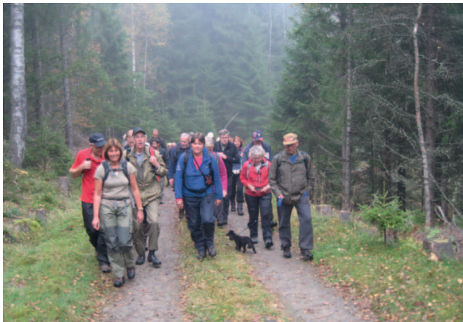
På vei mot Kølåbånn.

Lørdag morgen 1. oktober opprant med en famlende høstsol som prøvde å ta kontrollen over dagen. Solstrålene bredte seg utover den åpne flaten nedover Vardåsen der en ung elgokse skvatt vekk da en pesende kar dro forbi med en tung sekk fylt med alt som hører et skikkelig kaffebål til. En kort pause for å nyte morgenstemningen, og så bar det ned igjen til herredshuset i Enebakk for å møte forventningsfulle turgåere som ble forespeilet å kunne se til Gaustatoppen og Tryvann i det klare høstværet.