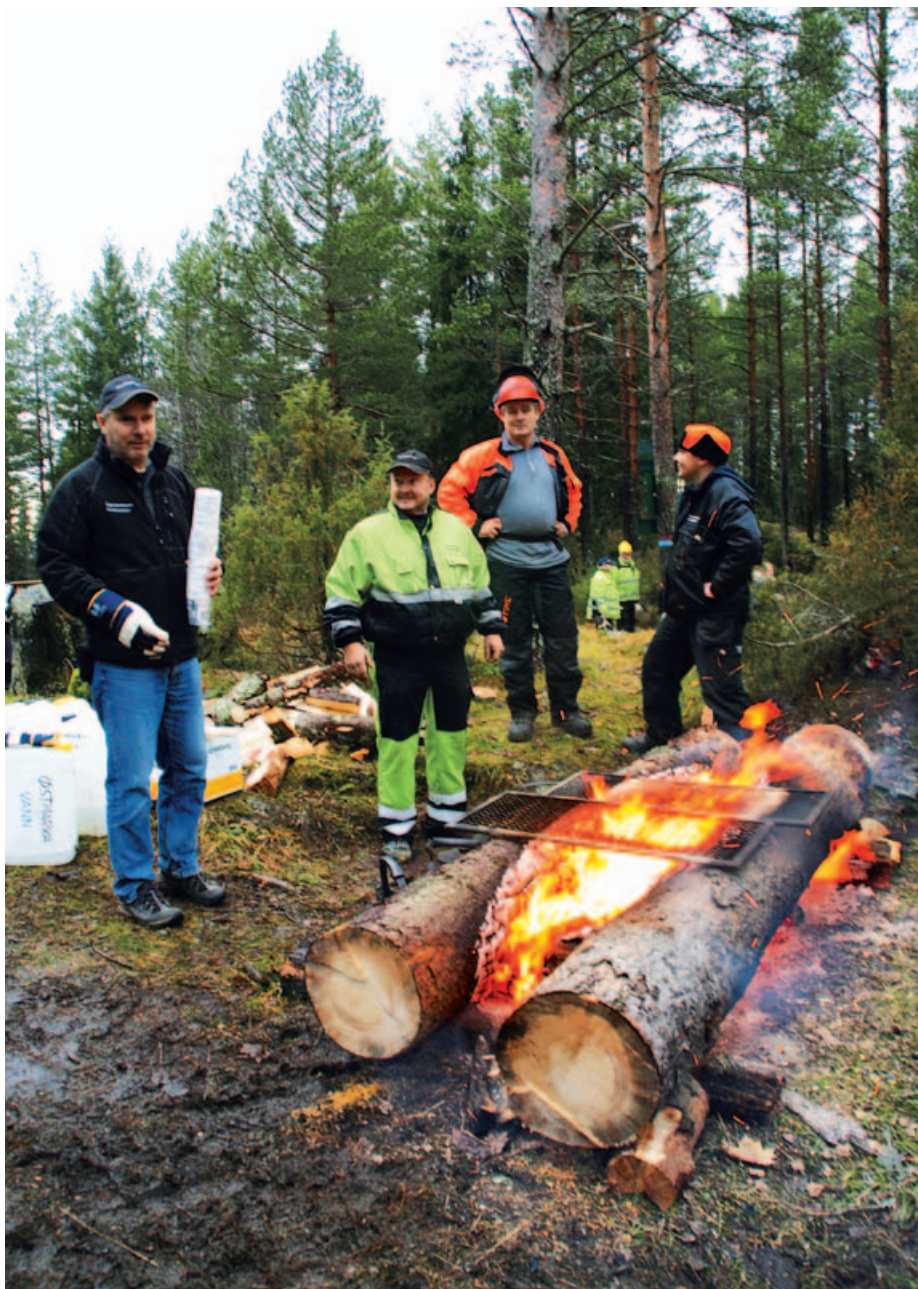
Skogskara ved stubbebålet.