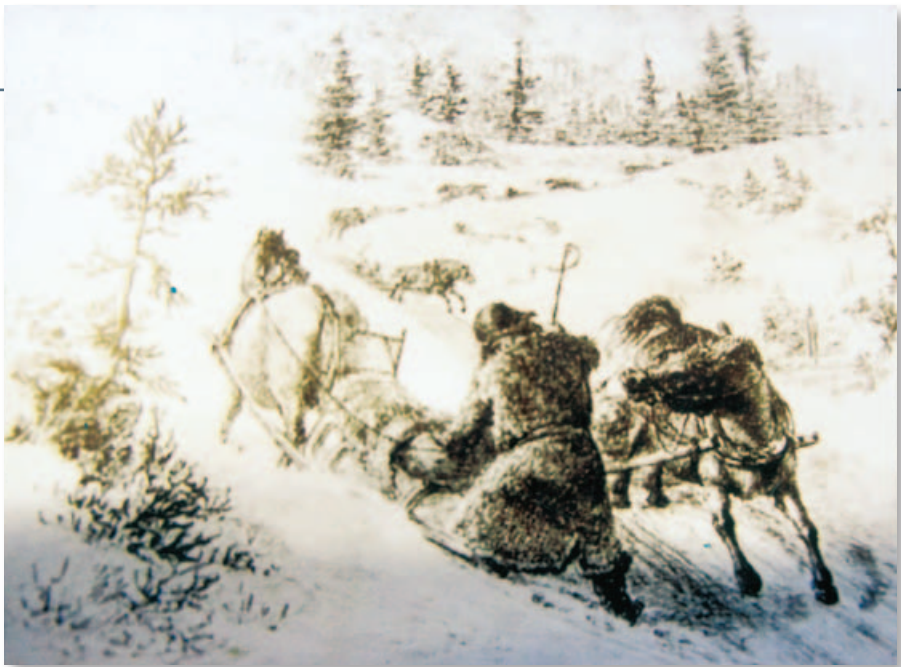
Plankekjørere møtes, tegning av Johs Flintoe fra boka Elgsbrenna.