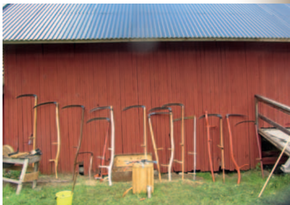
Ljåer i alle former og fasonger ved låveveggen på Bøvelstad.

Kombinert med sosialt samvær, bading og skogsturer i regi av den entusiastiske dugnadsgjengen i Østmarkas Venner ble det en opplevelsrik midtsommerhelg.