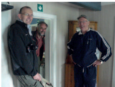
Glade gutter på stua.

Det er en fin helgetur å ta buss nr. 501 fra Oslo eller Lillestrøm til Flateby (stopp Gjeddevannsveien), følge blåmerket sti en kort dagsmarsj inn til Bøvelstad, overnatte der og så gå videre neste dag til Bysetermosan og ta buss nr. 501 fra Fjell til Oslo eller Lillestrøm. Alternativt kan man gå over Øvresaga og følge blåmerket sti herfra ned til RV 155 og ta samme bussen inn til byen. Det går også an å gå nordover til Røyrivannskoia og videre til Losby.