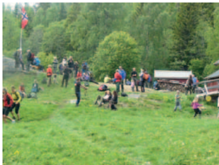
Flagget heises under åpningen.