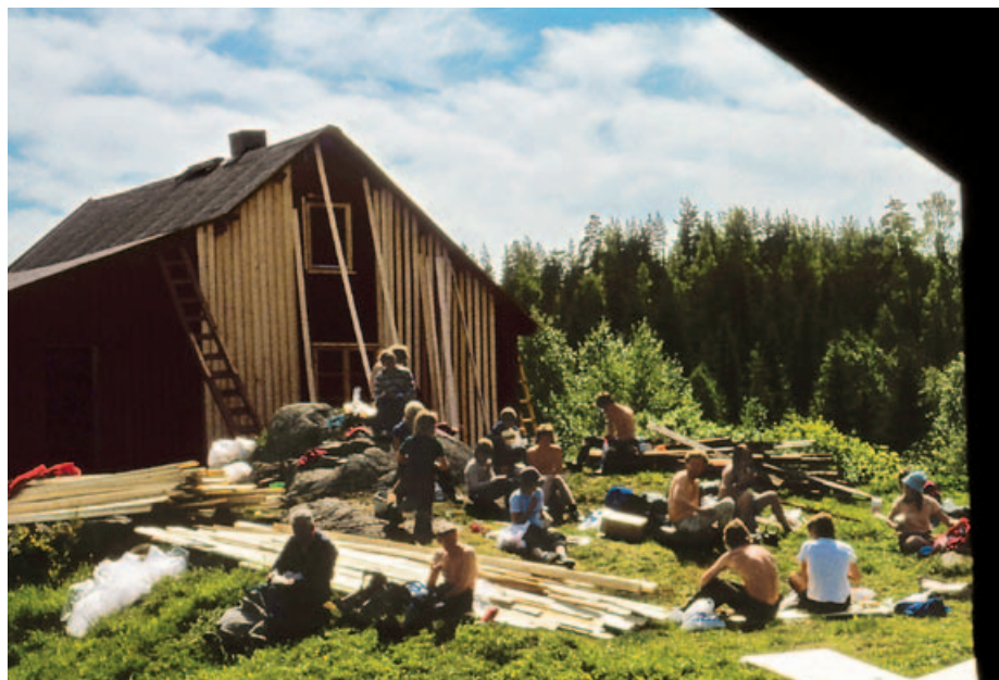
Lambertseterspeiderne restaurerer hovedhuset på Bøvelstad i 1973.