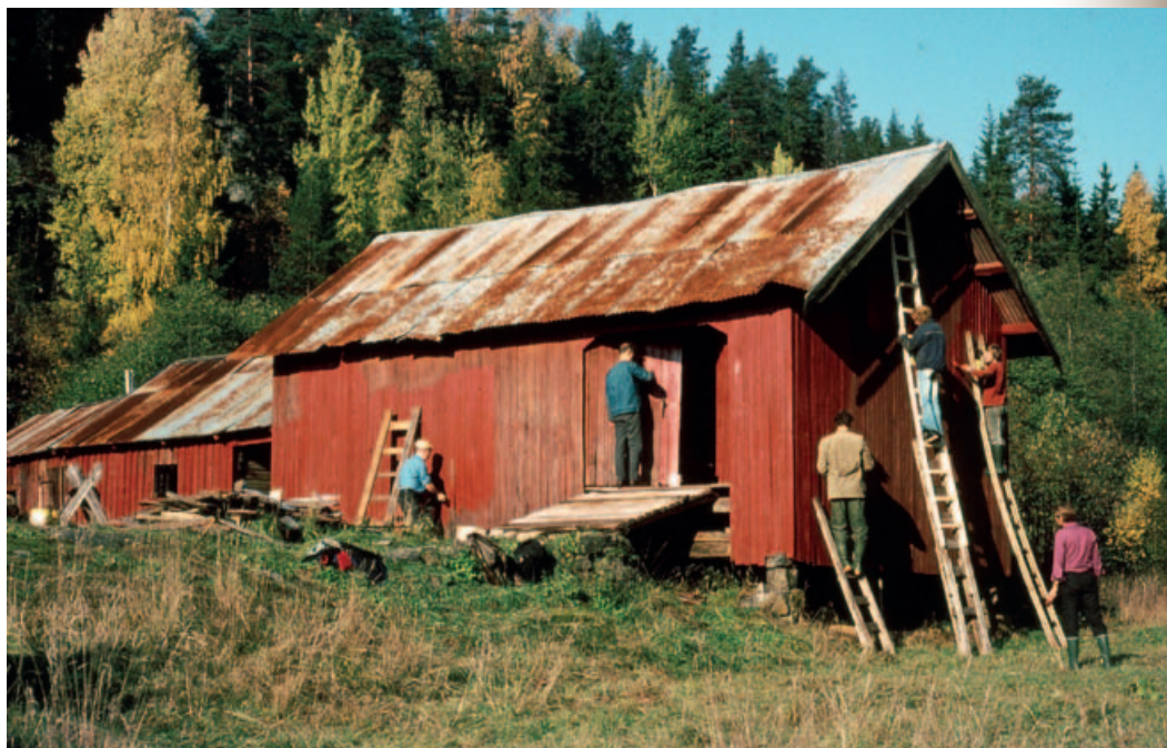
Låven males på dugnad av Lambertseterspeiderene i 1975.

Etter lov om opphavsrett kan materialet i denne artikkelen ikke kopieres eller brukes videre uten ved avtale med forfatteren.