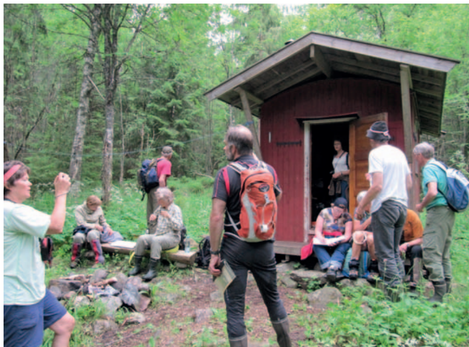
Samling på Brakka i Deliseterdalen.