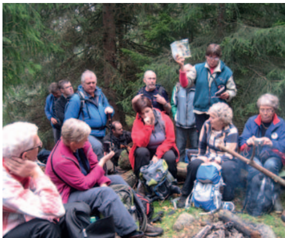
Kafferast på toppen av Vardåsen.

opp på dette fine utsiktspunktet bør bli en prioritert oppgave fordi turgåere ikke lenger finner fram når skogen gror til.