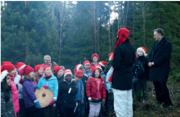
Elever fra Nøklevann skole sang vakkert for borgermester og ordfører.