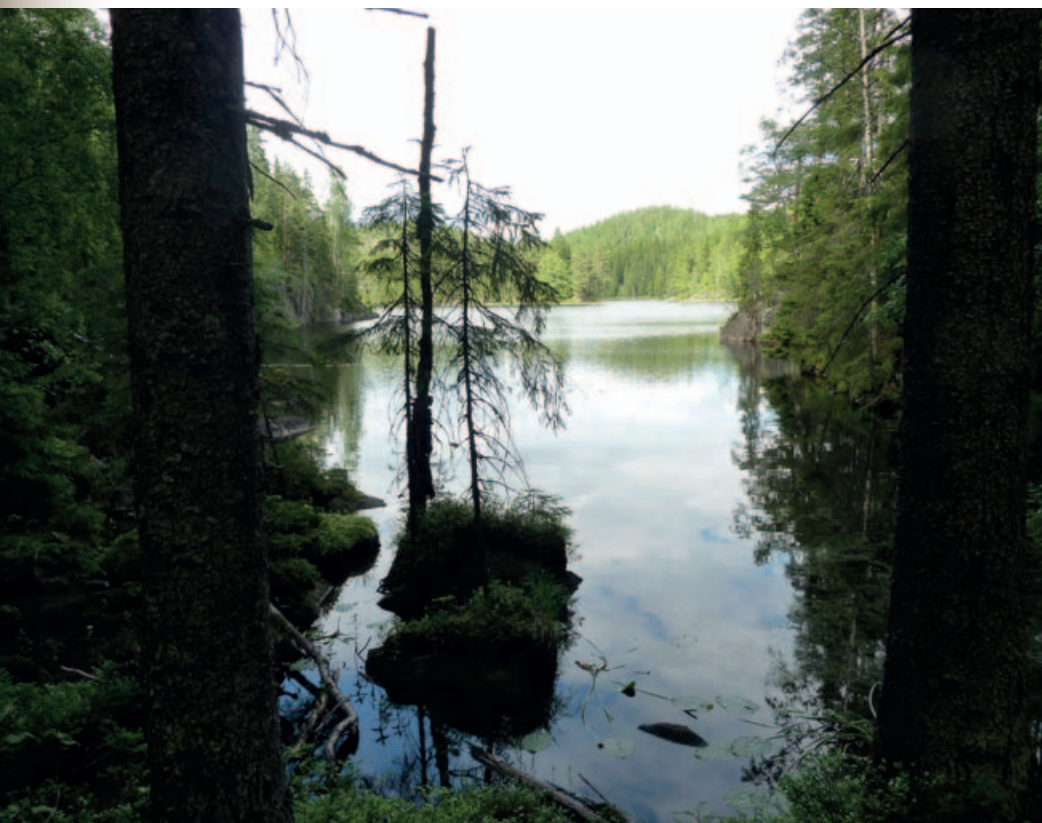
Søndre Krokvannskälven, sørvestre vik.

Og så gjenstår det uforlignelige Vestre Krokvanndsdråg. Et stykke reservatnatur mellom Søndre Krokvanne og Brakka som knapt kan