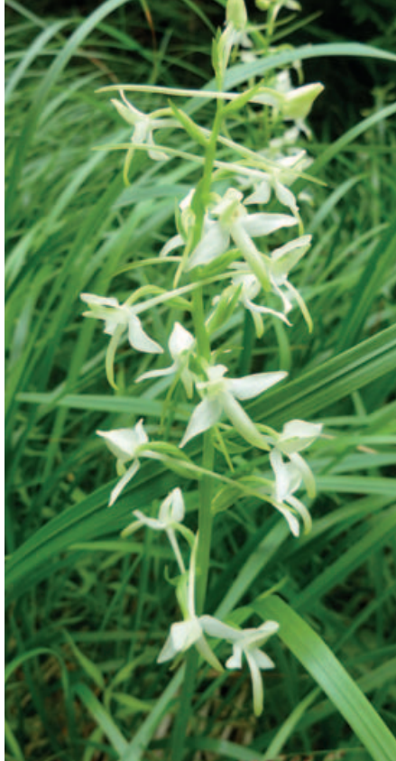
Duftende nattfiol.

Ti av oss fortsetter inn et storslått, men lettgått dråg, så over et par små koller og to mindre dråg, til vi når Ørnehogda, med villmark rundt oss så langt øyet rekker. På toppen er det rester av en slags fangsthytte murt opp av stein – trolig benyttet for rovfuglfangst, for en god del år siden. Så går det ned til Mellom Kytetjern, med turens andre rast på svabergene i vannkanten. Badenymfene legger ut på en ny svømmetur, før Jacobsen med sin GPS leder oss elegant til den eldgamle grensefurua sør for N. Kytetjern. Furu, med skår etter merkeøkser på tre steder, står i det gamle delet mellom Lørenskog/Losby og Enebakk/Rausjøskogene, først allmenningsgrense, nå kommunegrense. Men furua sier snart takk for seg, stokkmauren har gått til frontalangrep.