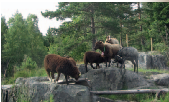
Fra mai til september går gammel norsk spelsau i området for å pleie kulturlandskapet.