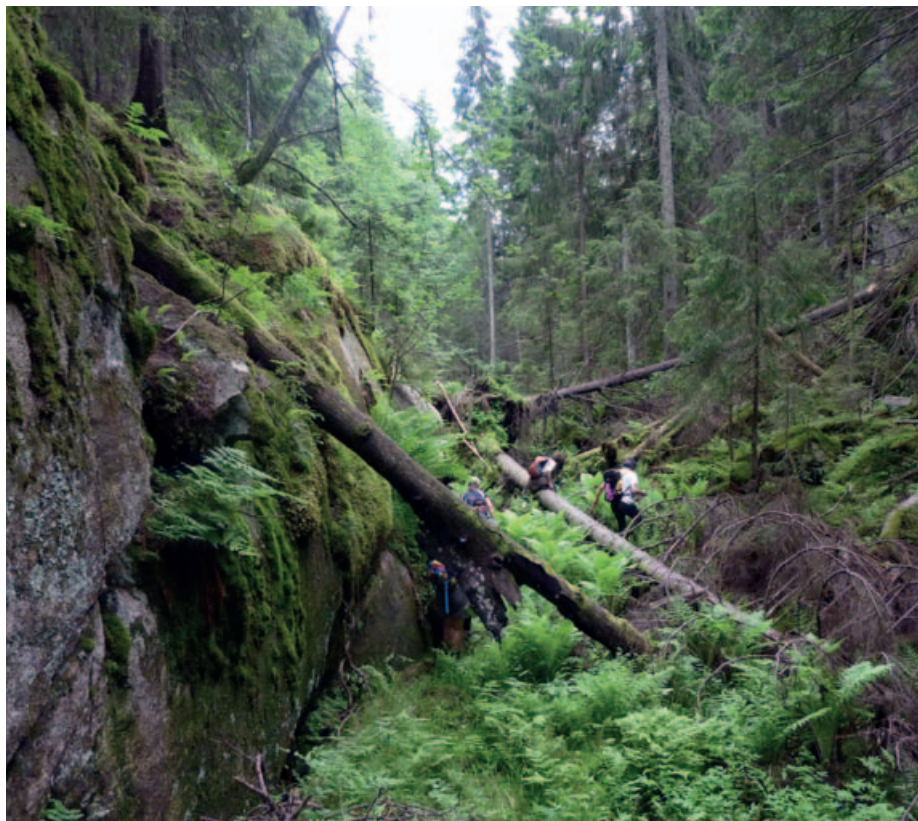
Vestre Krokvandrdåg sørover mot Deliseterdalen.

hvitveis som ennå blomstret, for å nevne noe. Og for annen gang i dag tar vi en pust ved Brakka, med følelsen av å være nesten hjemme. Tilbake til Bøvelstad har vi vært ute i 7,25 time, og tilbakelagt rundt 13 til dels seige, men eksklusive kilometer. De tre som skal tilbake til Bysetermosen vil gå nærmere 3 mil, så de kjenner det nok i beina. Bjørnar småløp og syklet hjem igjen til Flateby. Gjennomsnittsalderen på den lange runden var nette 63 år. Syv av ti hadde passert seksti år og tre var over sytti. Men fy fasan for en sprek gjeng!