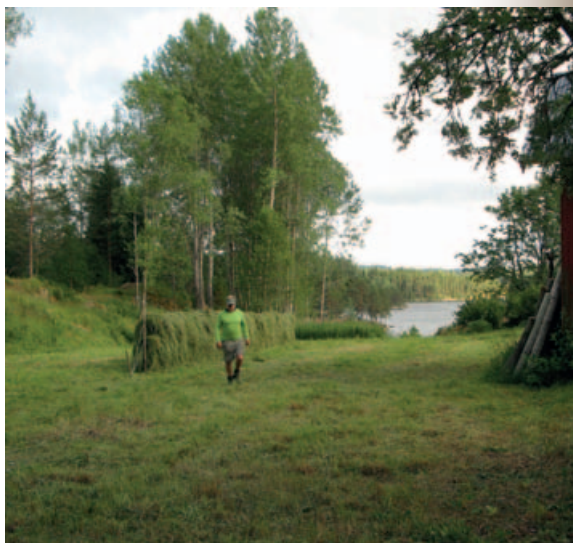
Etter over 30 års «hvile» henger høyet atter på hesjene.

Likevel var Bøvelstad plassen hvor man helst ikke burde bli sjuk, og det gjaldt like lenge som det bodde folk her. Det var ingen trygg