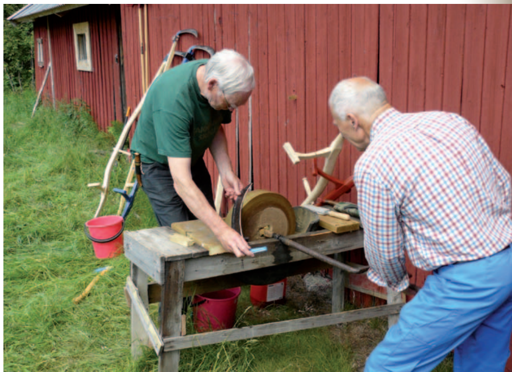
Slåttekara sliper lå ved låven som ble flyttet fra Myrsetra til Bøvelstad i 1924.

Sommerstid brukte folket på Bøvelstad «Deliseterkjerka» som kjøleskap til utpå 1900-tallet, slik seterfolket i sin tid hadde gjort. Til den romslige fjellhulen innerst i Deliseterfjorden, som har nærmest ståhøyde og en lengde på 7-8 meter, rodde de kjølevarene fra Bøvelstad.