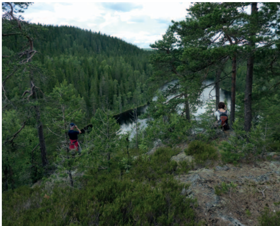
Ørneøyda mot Midtre Kytetjern.

Snart er vi over i Vestre Deliseterdalen - den er som en katedral, et lukket rom av høyreist, gammel granskog, med skogbunn i de nydeligste, intense grønnfarger. Alt er så friskt og