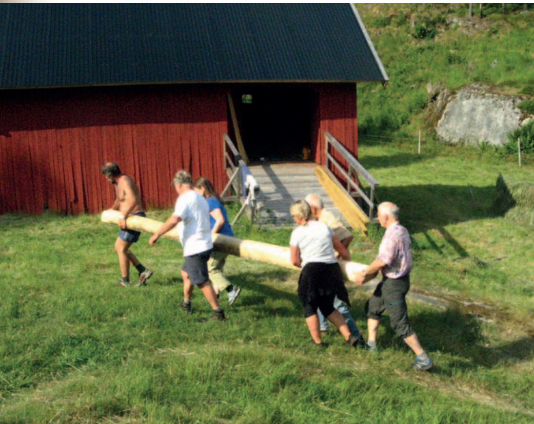
Dugnadsgjengen bærer stukk.

trivelig. Å spise god mat og prate er en like stor del av det som selve dugnaden. At vi kan bidra med noe som gir synlige resultater, gir oss på en måte belønningen for strevet. Det betyr mye for oss å kunne ta vare på kulturlandskapet og få vist hvordan det var på Bøvelstad i gode, gamle dager. Alle har et stort engasjement, er aktive og positive, så vi gleder oss alltid til å bruke tid sammen på Bøvelstad. Vi trives med å få muligheten til å leve litt primitivt på gam-