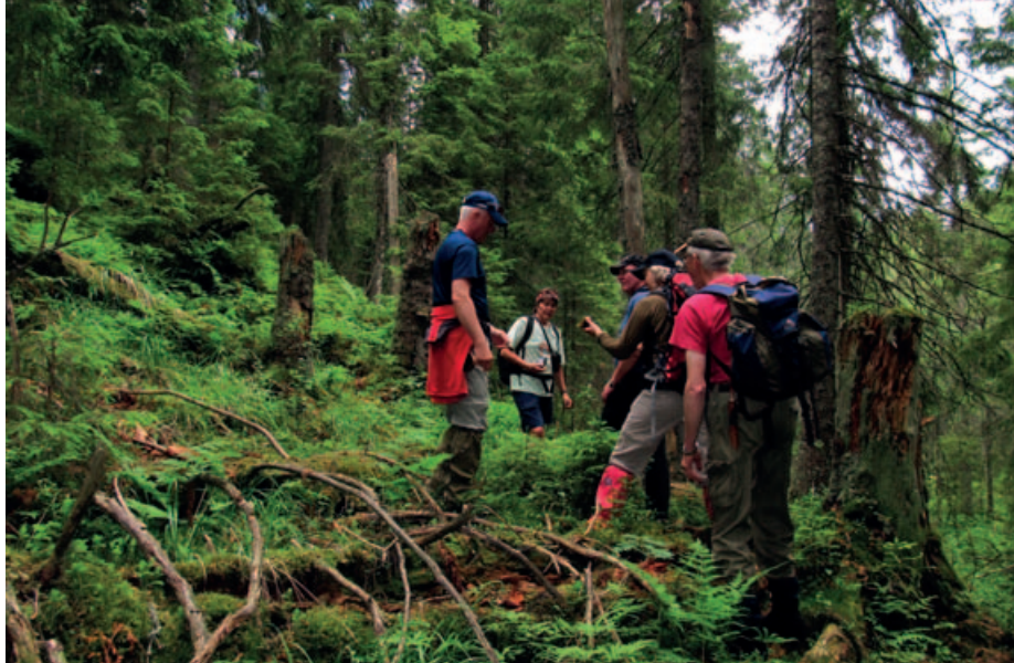
Naturstudier i reservatet. Turlederen i midten.