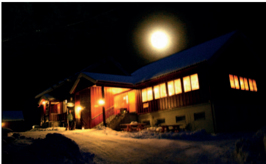
Sandbakken i måneskinn.

Ellers lokker vertskapet med mye gode bakervarer, fyr på peisen og fakkelfølge siste stykket fram til stua. Så her skulle det bli rett stemning enten du starter turen ved Ulsrudvann eller Ellingsrud og får 11-12 kilometer før du kommer inn i varmen, eller du nøyer deg med 3,5 km fra Krokhol eller 6 km fra Grønmo. Det går også an å gå til fots eller på ski fra parkeringsplassen 700 meter nedenfor Sandbakken.