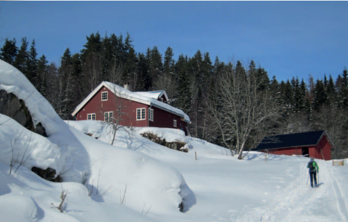
Bøvelstad nyrestaurert vinteren 2011.

En gang i historien valgte mennesker å slå seg ned på plassen Bøvelstad i Østmarka. Matauken var sikret med de mange fiskevannene i området, og kombinert med jakt og fangst i de dype skogene, ble området vurdert som tilstrekkelig for bosetting. Det kan ha begynt som en seter, for de få jordlappene rundt husene på Bøvelstad er små, trange og fuktige. Skogsbeitene må derfor ha vært av stor betydning. Etter en blomstringsperiode på første halvdel av 1900-tallet med stor aktivitet i skogene som ga tøm-