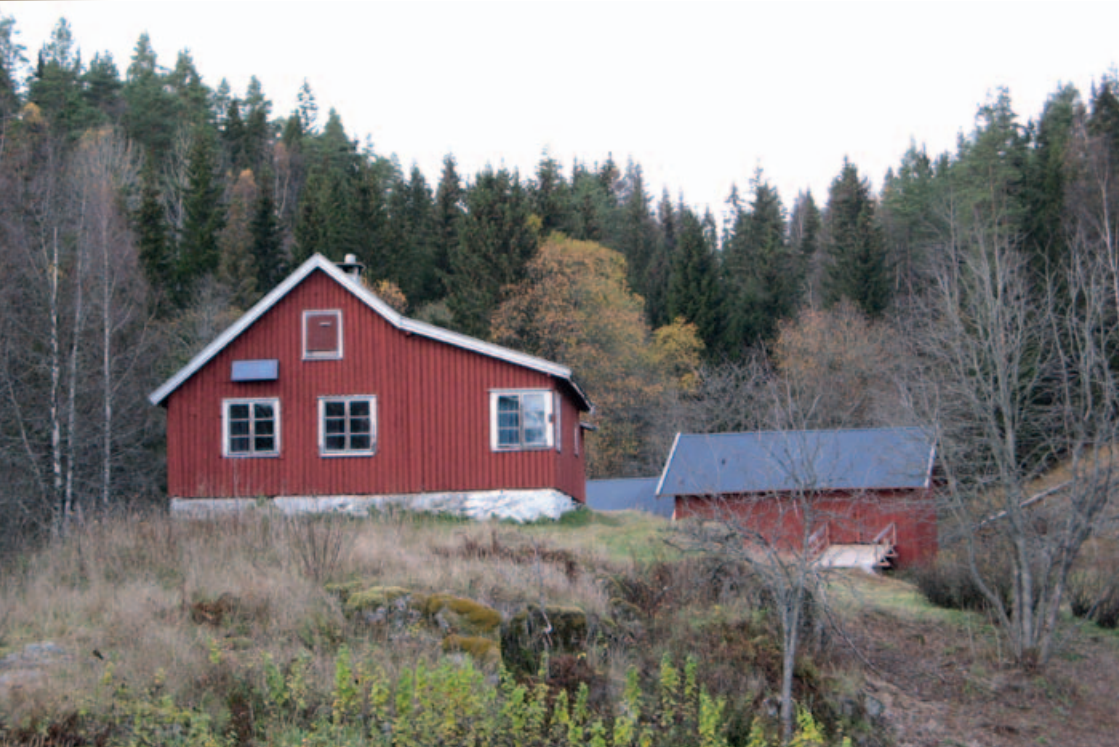
Bøvelstad høsten 2007.